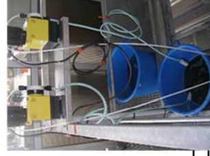
Système complet d'apport dans les canalisations