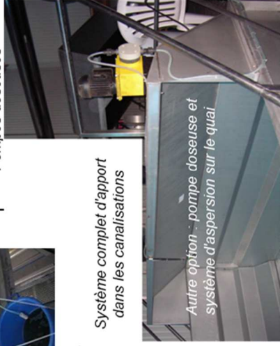
Autre option - pompe doseuse et système d'aspersion sur le quai